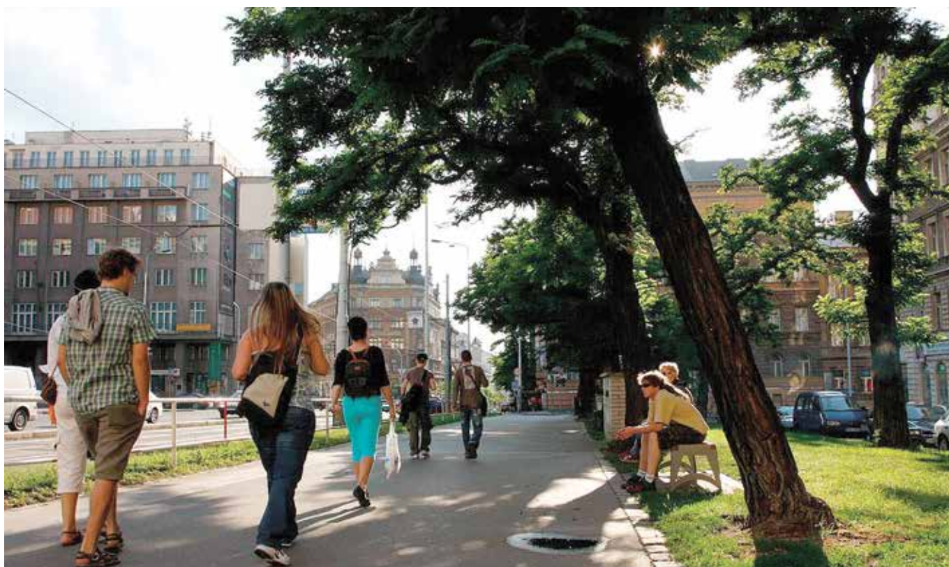
Stromy snižují prašnost a tlumí hluk

Tato pozitiva pro mikroklima a hygienu našeho prostředí vysoce převyšují některá negativa v souvislosti s alergenním působením pylu kvetoucích dřevin. Alergenní působení pylu je prokázáno u některých druhů větrosnubných dřevin a týká se jen omezeného období kvetení (u trav je toto období podstatně delší a jsou častějšími alergeny). Alergické působení stromů se navíc netýká poletujících plodů a chmýří (jak se často uvádí), ale skutečně jen velmi malých mikroskopických částeczek pylu.