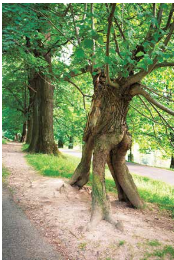
I poškozený či dožívající strom může být esteticky hodnotný a být i cenným biotopem

Lze oslovit i další znalecké ústavy (Mendelovu zemědělskou a lesnickou univerzitu v Brně – Zahradnickou fakultu, Výzkumný ústav Silva Taroucy pro krajinu a okrasné zahradnictví, v. V. I.) či soudní znalce v oboru ochrana přírody (dendrologie, posuzování zdravotního stavu dřevin), nebo v oboru ekonomika (oceňování dřevin a jejich výsadeb). Dále je možné oslovit odborného arboristu s certifikátem Evropský arborista (ETW) udělovaného pod záštitou Společnosti pro zahradní a krajinářskou tvorbu. I tyto osoby, které nejsou na seznamech vedených krajskými