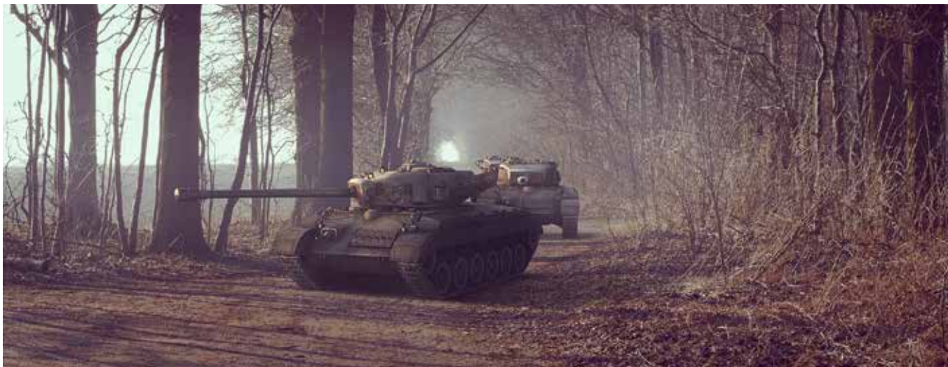
Cvičení ozbrojených sil

rostlin nebo živočichů (§ 56 ZOPK) či stanovení odchylného postupu (§ 5b odst. 1 ZOPK), je nutné kácení omezit nebo zakázat podle § 66 ZOPK.