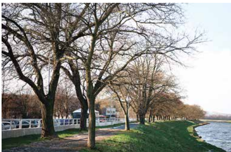
Alej na břehu Bečvy v Přerově

Správce toku sice může porosty pokácet a dokonce kvůli zpevnění břehů i nové vysadit, ale není považován za jejich vlastníka. Při obnově břehových porostů se přednostně využívají přirozené procesy (zejména kořenová a pařezová výmladnost, využití náletových dřevin). V případě výsadeb se využívají v místě původní druhy, které odpovídají daným stanovištním podmínkám.