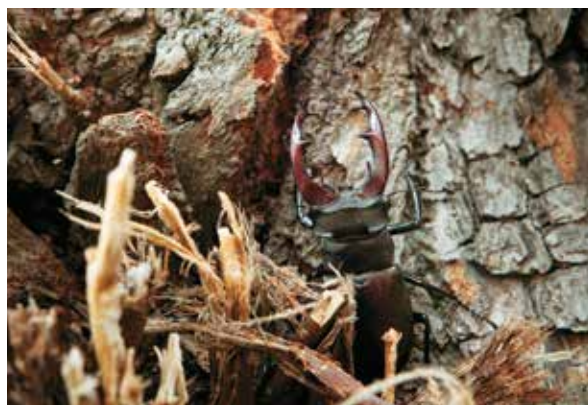
Roháč, Lucanus cervus , lipová alej v Uherském Ostrohu

Staré stromy s vytvořenými dutinami mohou poskytovat zimní úkryt kolonii netopýrů, nejčastěji netopýra rezavého ( Nyctalus noctula ), silně ohrožený druh. Velice často se taková kolonie objeví až během kácení. Je proto vhodné, aby strom předem zkontroloval specialista na netopýry – chiropterolog. Další