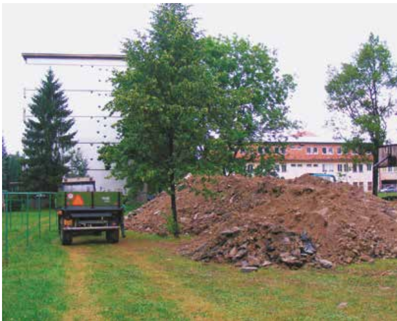
Ochrana stromů při stavebních pracích

Podléhá-li záměr (stavba) podle stavebního zákona posuzování v územním i stavebním řízení a je-li k jeho realizaci nezbytné kácení dřevin vyžadující povolení OOP podle § 8 odst. 1 ZOPK, je toto povolení podkladem nezbytným již pro vydání územního rozhodnutí. Povolování kácení dřevin má být vždy řešeno ještě před zahájením stavebního řízení – tedy ve fázi územního řízení před vydáním územního rozhodnutí nebo jej nahrazujících postupů podle stavebního zákona. Okamžik, kdy je žadatel oprávněn kácení dřevin provést, určí orgán ochrany přírody jako podmínku ve výroku rozhodnutí o povolení kácení (viz kap. 2.1.4.). Tímto okamžikem by mělo být nabytí právní moci stavebního povolení nebo jiného konečného správního aktu