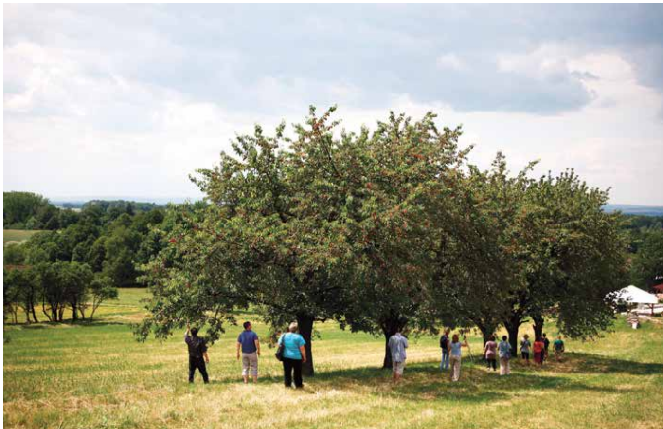
Stromy jsou součástí našeho životního prostředí