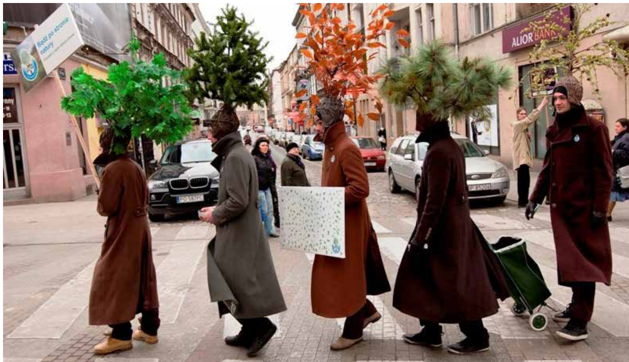
Kampaň na ochranu stromů v Polsku