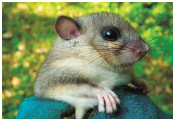
Plch velký často prospívá zimě v dutinách stromů

V odůvodněných případech, typicky byla-li žádost o kácení podána z důvodů špatné statiky stromu (riziko vyvrácení či rozlomení kmene stromu) a je-li prokázán výskyt zvláště chráněného druhu živočicha, je možno zajistit stabilitu stromu vhodným technickým opatřením (stažení kmene obručemi, ořez „na hlavu“, ponechání torza apod.). Strom, nebo jeho část zůstává na původním místě a dále slouží jako biotop vzácného živočicha. Tento speciální případ pak není posuzován jako nedovolený zásah do dřevin dle § 2 ZOPK.