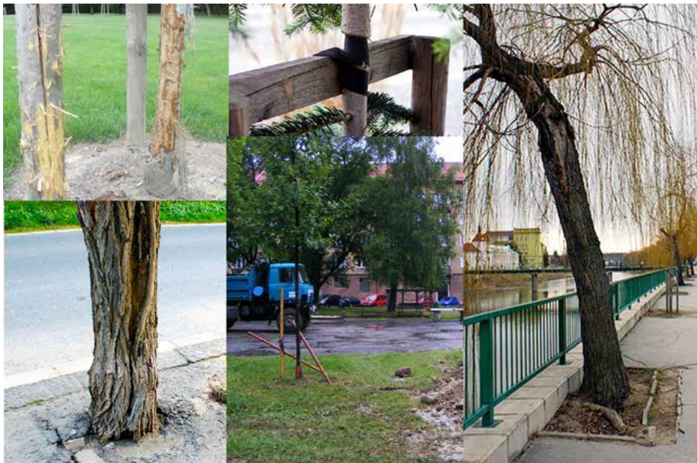
Příklady špatné povýsadbové péče, vandalizmu a ignorance

Řez stromů – Standardy péče o přírodu a krajinu, AOPK, řada A, SPPK A02 002: 2013