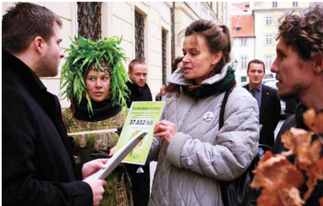
Předání petice Zachraňme stromy na MŽP v Praze

nost např. Vyvěšením letáků na vchody domů nebo umístěním cedulí přímo do příslušného parku nebo zelené plochy. Podobný systém se osvědčil i při umísťování staveb podle stavebního zákona. V případě, kdy lze předpokládat rozsáhlejší polemiku o vhodnosti daného záměru (ať už samotného kácení, nebo např. umístění stavby, která si vyžádá kácení), je vhodné uspořádání kulatých stolů, besed s občany, dotazníkového šetření nebo jiných akcí, které umožní veřejnosti získat informace a uplatnit připomínky. Správní orgán se tak vyhne zbytečným průtahům během samotného řízení a předejde podání odvolání.