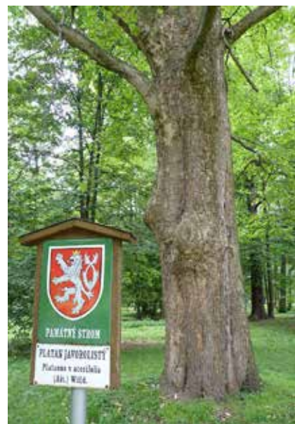
Památné stromy okresu Karviná