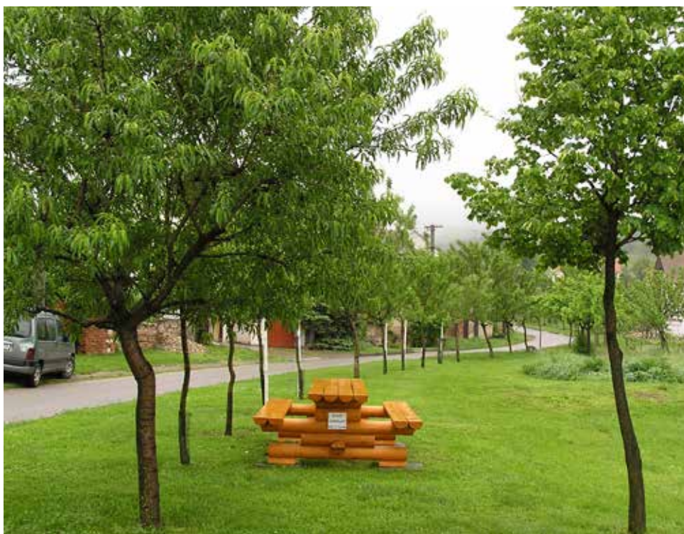
Stromy zvyšují kvalitu bydlení

V praxi se prokazuje, že zeleň zvyšuje atraktivitu měst a obcí a také hodnotu nemovitostí. Cena bytů s výhledem do zeleně může být až o desítky procent vyšší, než je obvyklá cena v příslušné lokalitě. Parky a stromořadí zvyšují oblibu městských čtvrtí k bydlení.