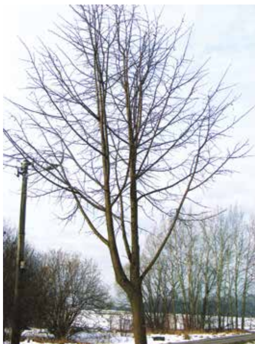
Absence výchovného řezu v mladém věku stromu (podpora hlavní osy kmene stromu, eliminace defektních větvení) (foto Marcela Klemensová)