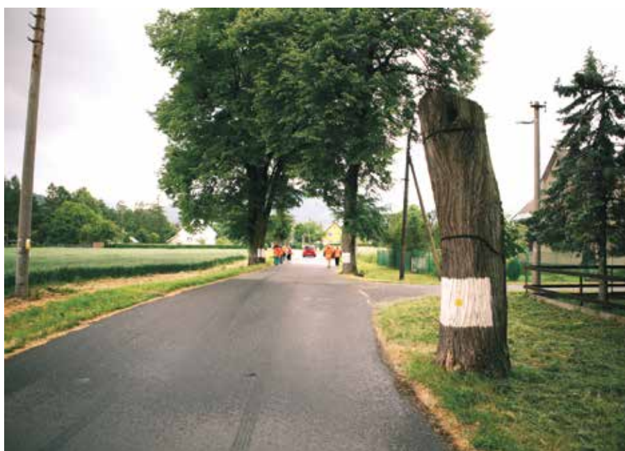
Komorní Lhotka – lipová torza jako biotop páchníka Osmoderma barnabita