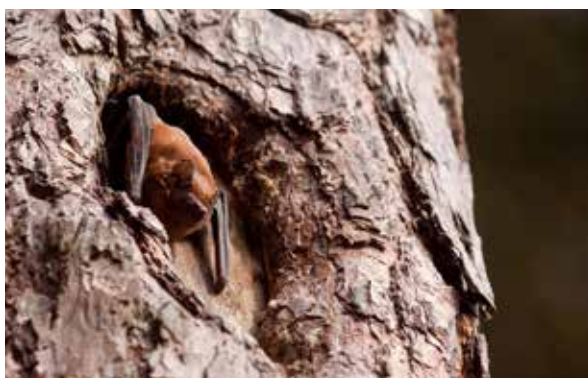
Netopýr rezavý