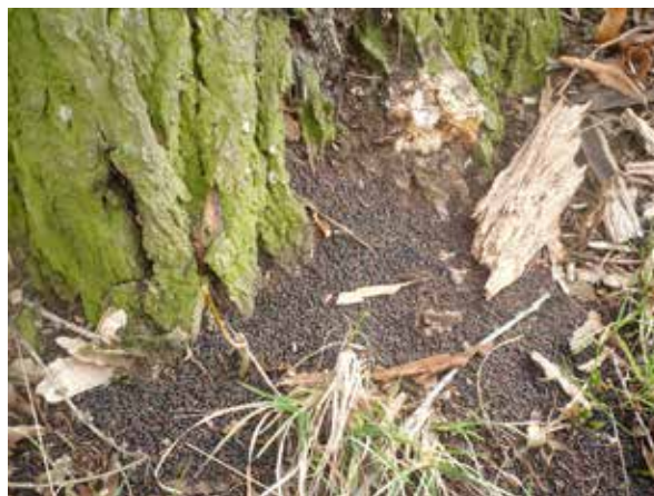
Trus páchníka, Osmoderma eremita , v lipové aleji Radkov – Dubová