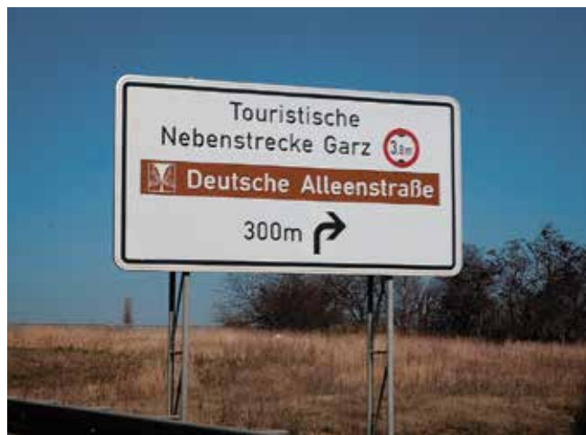
Aleje jako součást turistického ruchu – německá alejová cesta

Jak ukazují statistiky, příčinou dopravních nehod nejsou nikdy stromy. Nejčastější příčinou havárie je jízda po nesprávné straně a nepřizpůsobení rychlosti stavu vozovky. Náraz do stromu je pak už jen důsledkem špatné jízdy řidiče. Vysoký počet dopravních nehod na českých silnicích nevyřeší vykácení alejí, ale spíše vzdělávání řidičů a přísnější postihy za nebezpečné přestupky.