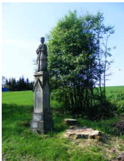
Bez alejí by byla naše krajina jako obraz bez rámu

Pro kácení v alejích je třeba povolení. Toto povolení je zapotřebí i tehdy, pokud stromy nedosahují potřebného obvodu kmene (80 cm ve výšce 130 cm nad zemí), nebo pokud by rostly na oplocené zahradě u rodinného domku. Povolení ke kácení vydává příslušný orgán ochrany přírody, což je zpravidla obecní či městský úřad. O povolení může požádat vlastník pozemku nebo jeho nájemce se souhlasem vlastníka (viz také kap. 2.1.)