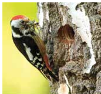
Strakapoud prostřední ( Dendrocopos medius )

Strakapoud prostřední ( Dendrocopos medius )