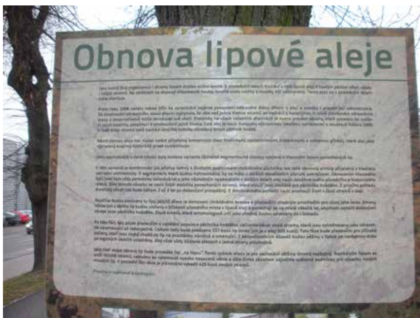
Město Jičín informuje občany o rekonstrukci aleje

V současnosti se veřejnost dozvídá o plánovaných zásazích do zeleně zpravidla prostřednictvím spolků. V některých případech mají úřady povinnost zveřejnit informaci o zahájených řízeních na úřední desce. Tu však většina běžných občanů pravidelně nečte a obecní úřady příliš nedbají ani o povinnou elektronickou obdobu úřední desky na internetových stránkách obce. Některé obce proto přikračují k nadstandardním krokům nad rámec jejich právních povinností. Při plánovaném kácení většího rozsahu je vhodné informovat místní veřej-