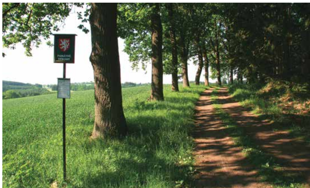
Ilustrační foto – Alej v Třešti