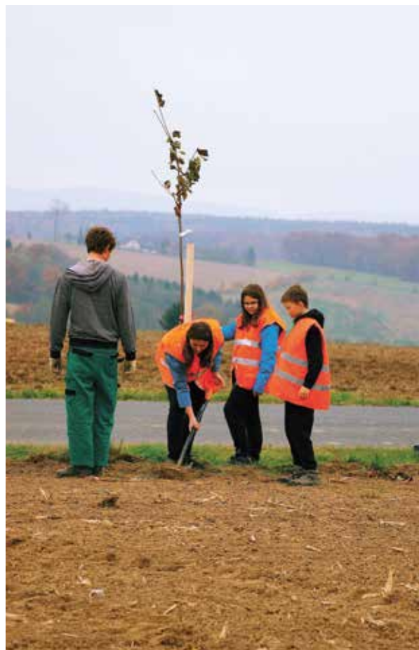
Výsadba třešňové aleje, Štípa, 2014

Náhradní výsadba by neměla být vnímána jako trest za kácení, kompenzuje se jí legálně vzniklá ekologická újma (na rozdíl od ukládání tzv. nápravných opatření podle § 86 odst. 2 zákona o ochraně přírody). Náhradní výsadba se ukládá zároveň s rozhodnutím o povolení kácení, a aby měla smysl, měla by být doplněna i uložením povinnosti péče o dřeviny. Zákon o ochraně přírody nechává v ustanovení § 9 odst. 1 na úvaze úřadu, jestli vůbec kompenzace stanoví. Pokud ale vezmeme v úvahu zásady činnosti správních orgánů a povinnosti přímo orgánů ochrany přírody (především střežit veřejný zájem na ochraně životního prostředí), je nutné uložit náhradní výsadbu vždy, když kácením dřevin vzniká ekologická újma. Pokud se úřad rozhodne uložit jen minimální kompenzaci (nebo výsadbu na jiném místě, než se kácí, a bez povinnosti péče o vysazené dřeviny), musí o to pečlivěji a zcela exaktně své rozhodnutí vysvětlit a popsat důvody, které jej k němu vedly.