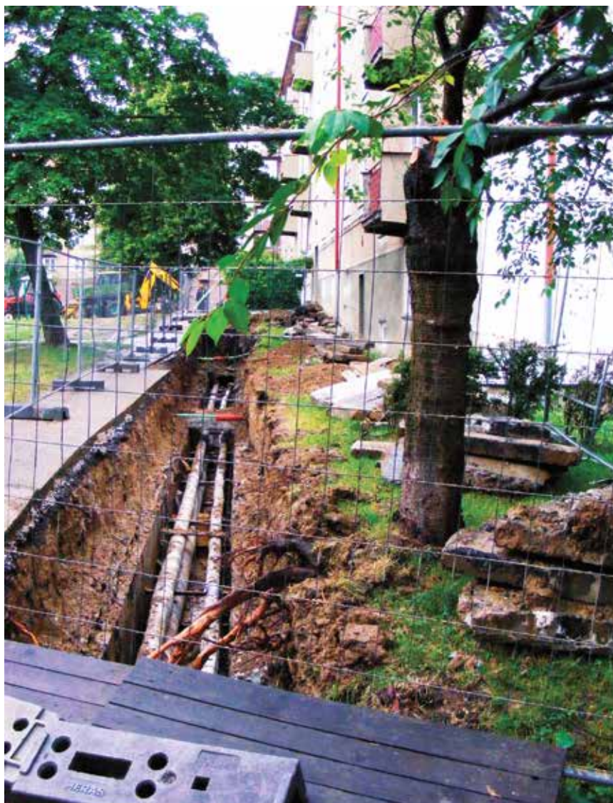
Náhradní výsadba na špatném místě – stromy vysázené jako náhrada za ty pokácené při stavbě parkoviště se během několika let dostaly do kolize s opravou horkovodu

č. 189/2013 Sb. o ochraně dřevin a povolování jejich kácení) nebo jiné skupiny dřevin (např. rozvolněnou skupinu dřevin nebo solitérních jedinců v parcích a na hřbitovech, příp. i ve volné krajině), ve kterých nevznikají specifické podmínky porostu a vzájemné působení dřevin a tudíž i výchovné zásahy jsou minimalizovány, resp. mají charakter ošetřování jednotlivých dřevin. Typickým příkladem porostu je zapojený porost dřevin ve smyslu § 1 písm. A) vyhlášky č. 189/2013 Sb. nebo intenzivně pěstovaný zapojený ovocný sad.