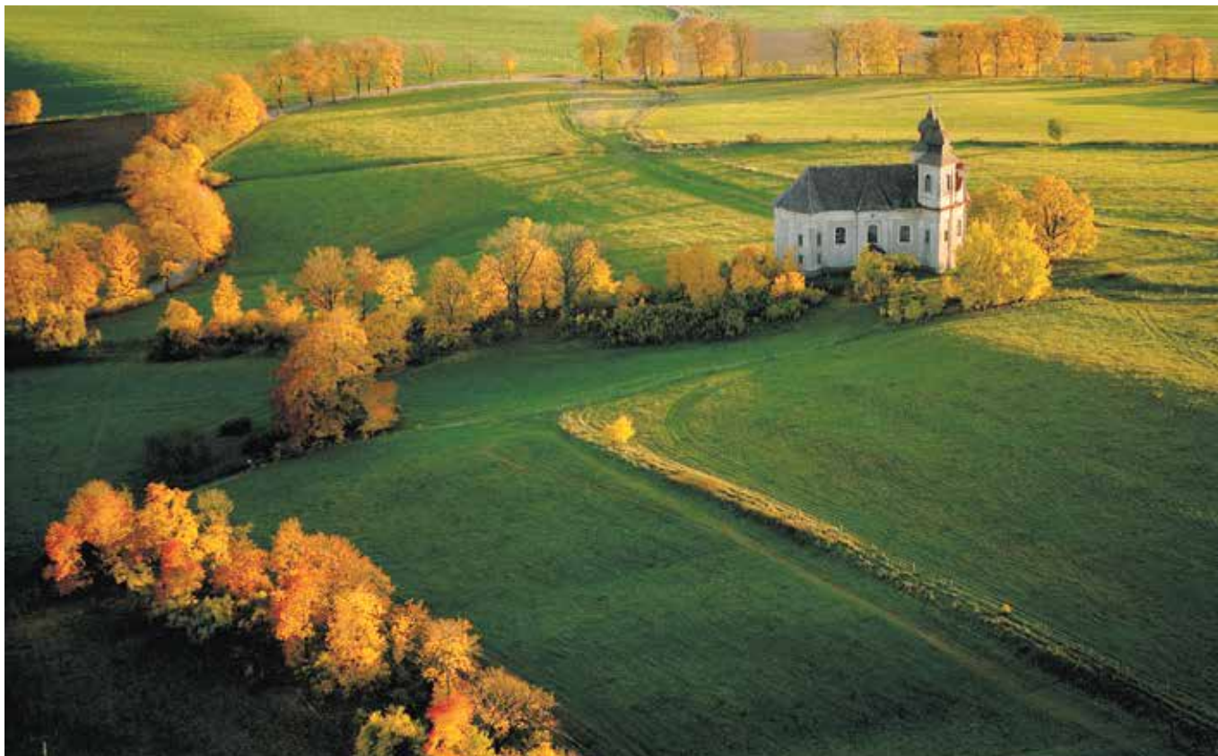
Aleje jako krajinný prvek vedoucí k významným místům