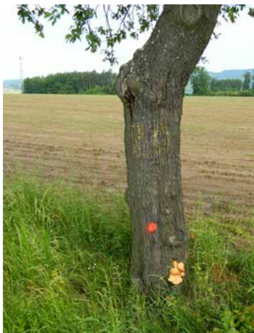
Špatný zdravotní stav švestky – hniloba kmene a napadení sírovcem

Podle výkladu MŽP lze za zdravotní důvody považovat jen takové situace špatného zdravotního stavu dřevin, kdy možná náprava spočívá výhradně v pokácení dřeviny. V praxi se jedná zejména o epidemické nákazy (grafióza jilmů, šárka u švestek apod.). Při výskytu nákazy může orgán ochrany přírody dokonce kácení sám uložit. Za zdravotní důvody nelze považovat nízkou vitalitu dřeviny, zejména, je-li tento stav stromu důsledkem zanedbání péče.