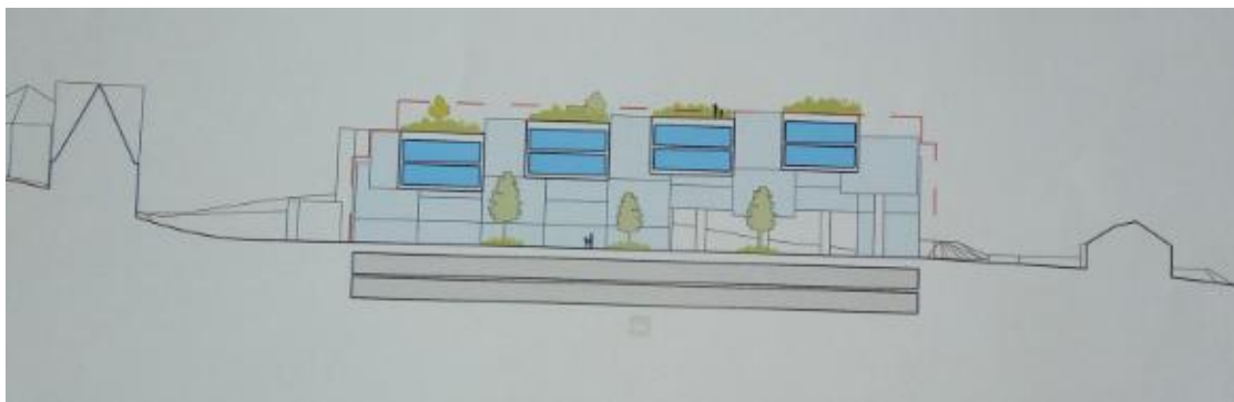
řez stavbou vedený kolmo k ulici Na Cihlářce