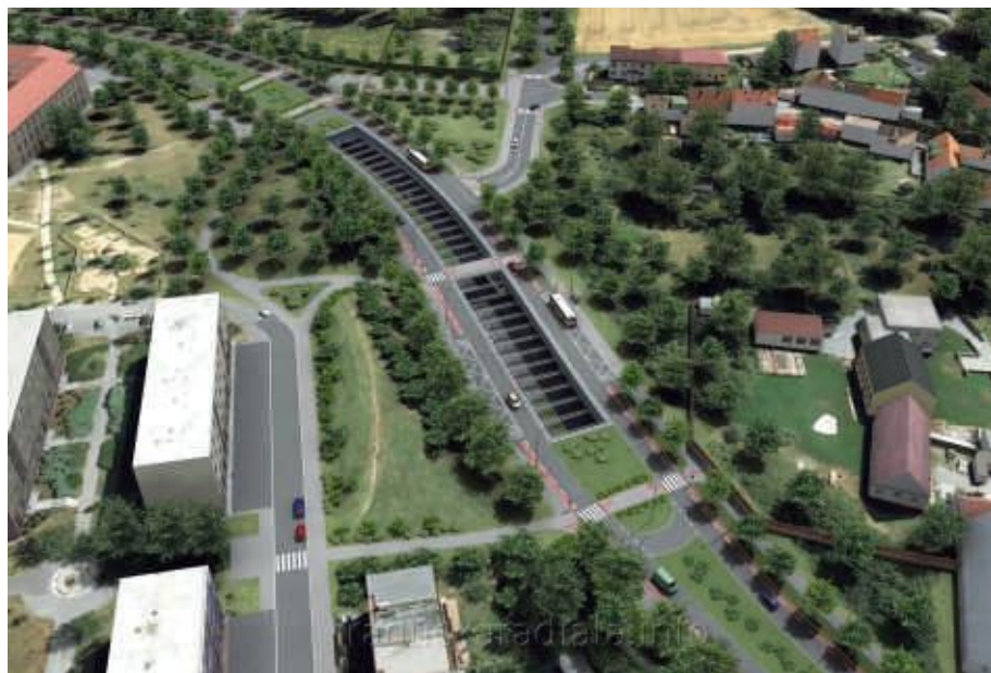
OTEVŘENÝ ÚSEK MEZI TUNELY V BLÍZKOSTI TYRŠOVY ŠKOLY A JINONICKÉHO SÍDLIŠTĚ - SOUČASNÝ NÁVRH INVESTORA.

1) Zamezení rozlévání dopravy do staré zástavby v případě dopravní zácpy na radiále.