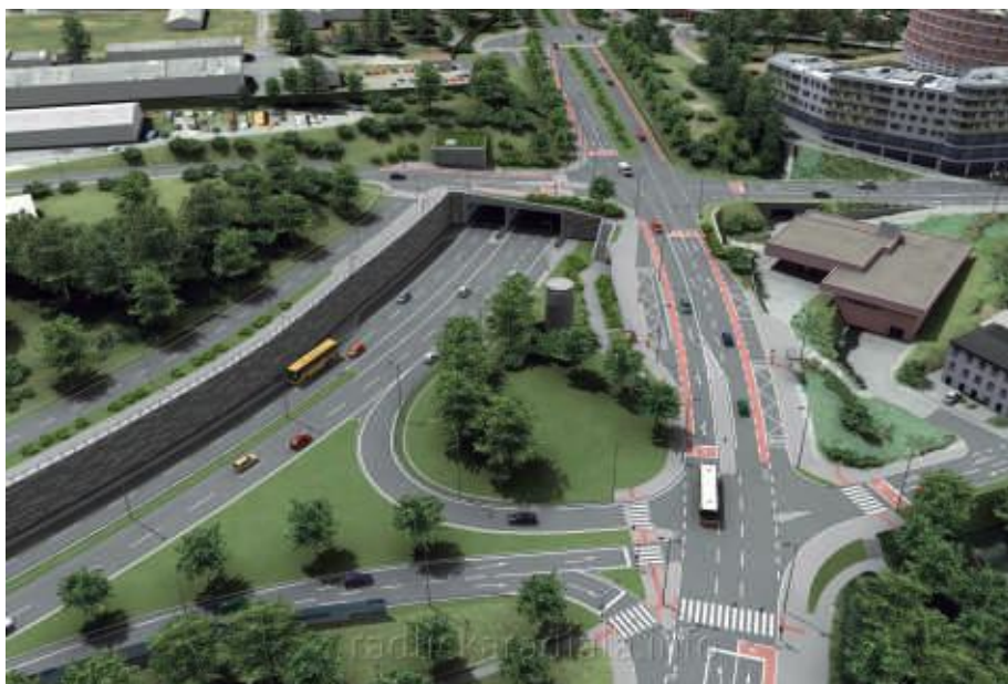
OKOLÍ STANICE METRA JINONICE – SOUČASNÝ NÁVRH INVESTORA.

Naším cílem není stavbu radiály zastavit, snažíme se prosadit řešení, které bude mít co nejmenší negativní dopad na místní obyvatele při co největším zachování výhod, které bydlení v Jinonicích a Butovicích nabízí.