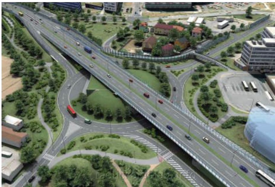
KŘÍŽOVATKA ŘEPORYJSKÁ JE DLE SOUČASNÉHO NÁVRHU INVESTORA SITUOVÁNA V OBLASTI MEZI JINONICKÝM ZÁMEČKEM A STANICÍ METRA NB.

Přes očekávanou vysokou intenzitu dopravy jsou v projektu pro