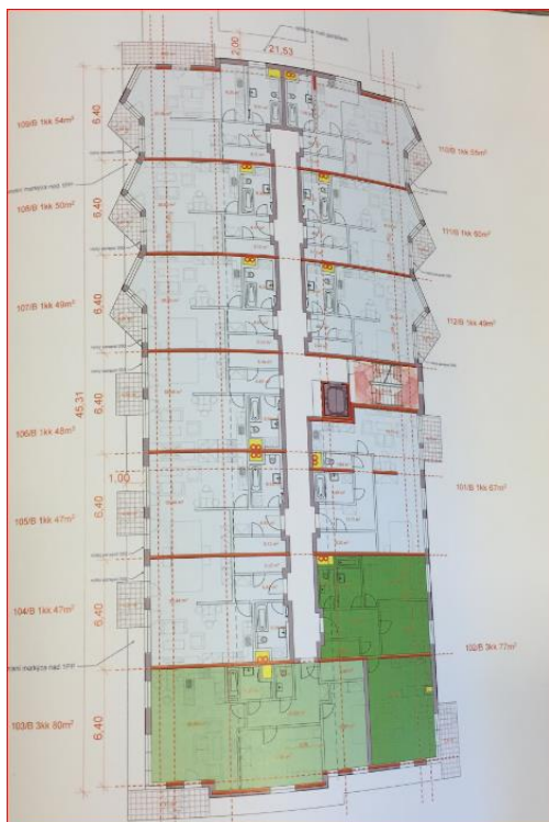
Obr.1 DUR stavby Kaskády IV, V