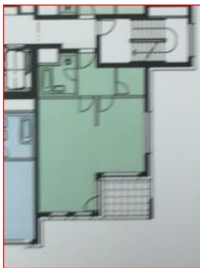
Obr.4 Kaskády H – příklad dispozice bytů 1+kk