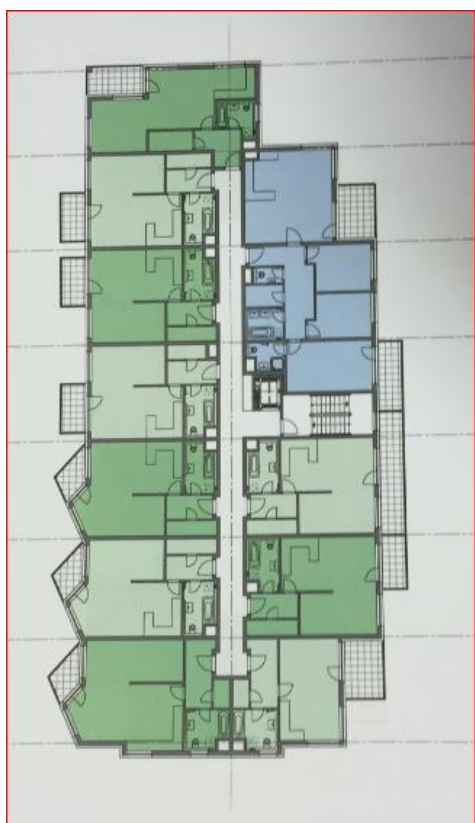
Obr. 3 Kaskády F – DUR, dispozice bytů 1+kk