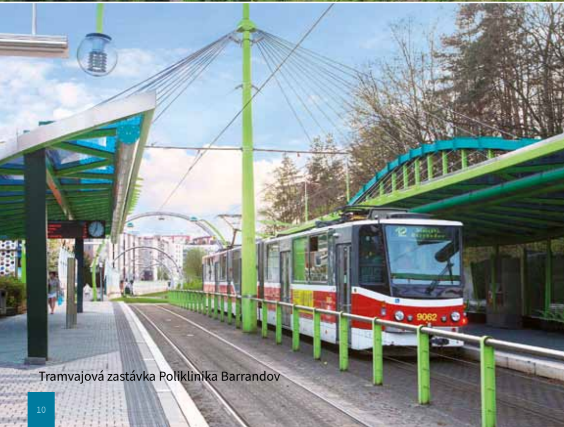
Tramvajová zastávka Poliklinika Barrandov