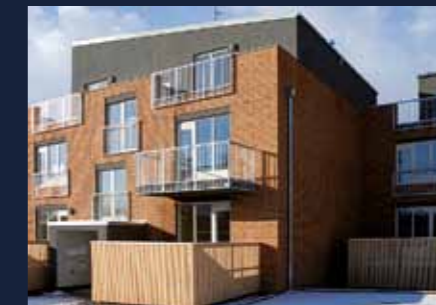
Zahrady Uhřetěves Best of Realty 2008, 2. místo