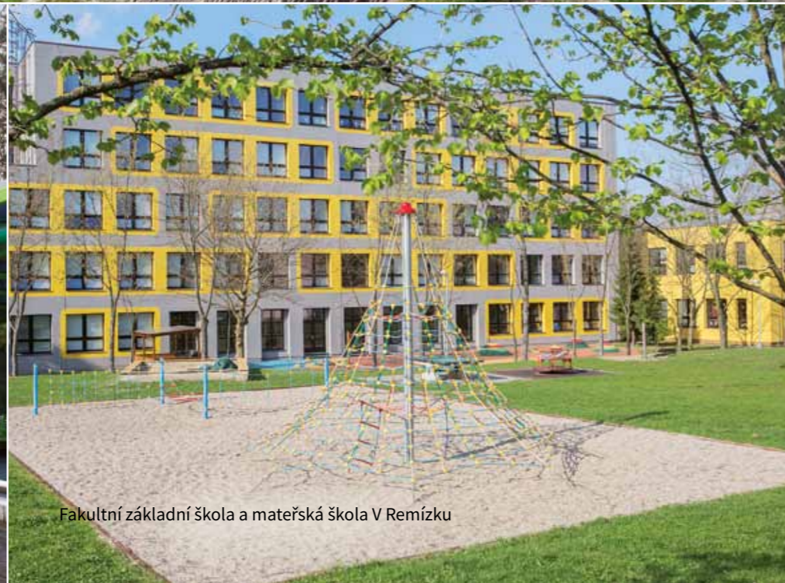
Fakultní základní škola a mateřská škola V Remízku