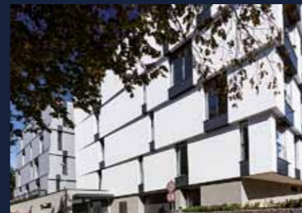
WhiteGray Residence Best of Realty 2016, 3. místo

Jsme stabilní společnost s 25 lety zkušeností. Když se ohlédneme v čase, vidíme řadu úspěšných projektů, mezi které patří například: