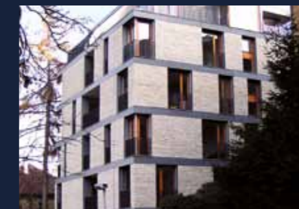
Bytová vila Mrázovka Best of Realty 2004, 1. místo

Nad svou prací přemýšlíme a věříme, že na výsledku je to znát. Vyznáváme férový byznys – zakládáme si na tom, že jsme za všech okolností spolehlivým obchodním partnerem. S námi můžete bydlet a investovat bez obav.