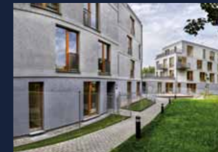
Projekt Pod Ladronkou kolaudace 2013