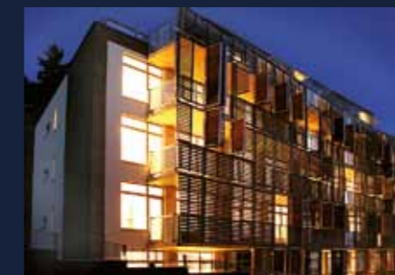
Apartmány Čertovka Best of Realty 2005, 2. místo