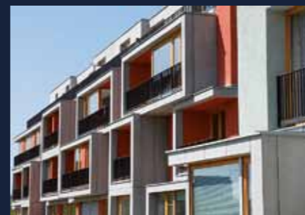
Vila Park Jinonice kolaudace 2007