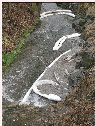
Norné stěny bohužel účinkovaly jen krátkodobě.

Motto: „Pravda vyjde nahoře jako olej na vodu!“