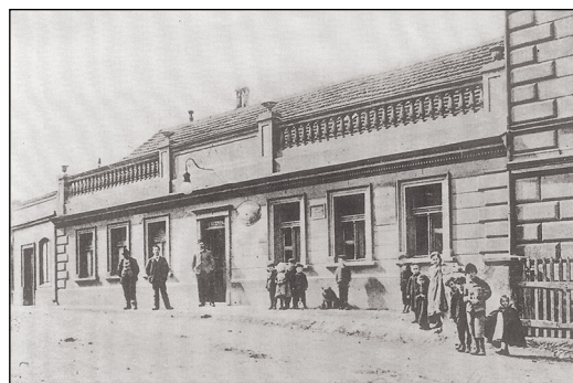
Restaurace U Kubů

budova bývalé restaurace U Zábranských , v patře je sál a také zde se pořádaly plesy a tancovačky, ale jejich pořádání kdysi ustalo ze statických důvodů poté, co se pod tanečníky rozhoupala podlaha sálu. V objektu býval mandl, kadeřnictví, prodejna potravin a napo-