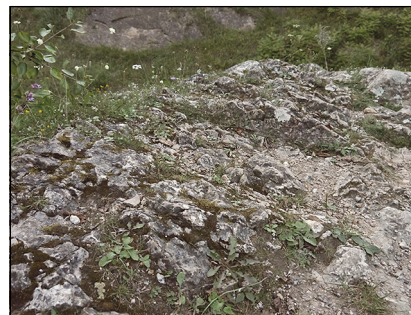
Že Prokopák tvoří vápence, dokazují na povrchu například tzv. škrapy. Stejně najdeme v jeskyněmi proslulém Moravském krasu.

Ale o několik let později, když už slavná jeskyně neexistovala, se zdejší podzemní vody opět při-