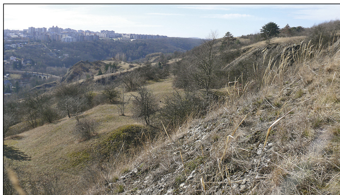
Co se skrývá pod těmito pahorky?

na spisovatele Jakuba Arbesa, který ve své knize „Okolí Prahy“ o tom vypráví takto: „... když procházím přes hluboké rozsedliny, slyšetí neustále cvrkot kapek a temný hukot podzemních vod, čímž dojem příšernosti nemálo se zvyšuje, zvláště, když si připomeneme, že nalé-