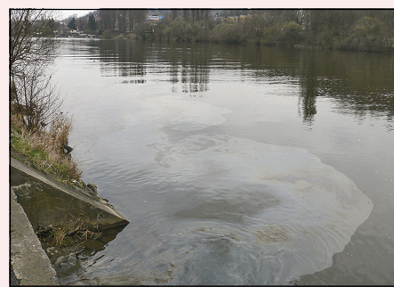
Třetí den havárie – vyústění Dalejského potoka do Vltavy v ochranném pásmu vodního zdroje Podolské vodárny.

Připravuje se další stavba, a to přímo nad místem, kde stála továrna, kde se skladovala přímo plejáda chemikálií. A teď se nabízí otázka. Zajistil někdo rozbor pudy z míst pod továrnou? Pokud ano, co zjistil? A v případě, že