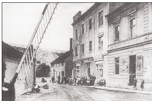
Besední restaurace v minulosti

Při Prokopské pouti v červenci bývaly stánky a pouťové atrakce pod skalou, kde stával kostelík sv. Prokopa a odtud se táhly až k prvnímu železničnímu podjezdu. V těsné blízkosti na vyvýšeném terénu stál hostinec U Kordů se zahrádkou pod kaštaný, který uspokojoval