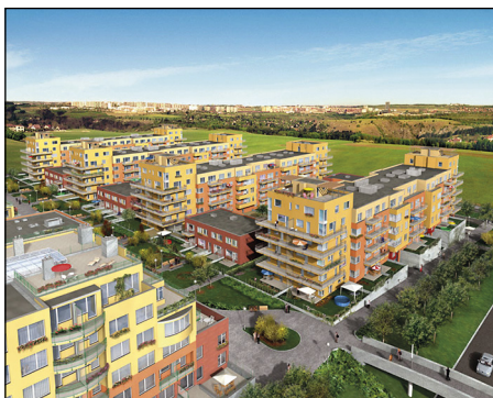
První kousek Kaskád již stojí. Tento způsob zastavování po částech, tzv. „salámová metoda“, umožňuje při vstřícnosti úřadu obcházet požadavky územního plánu.