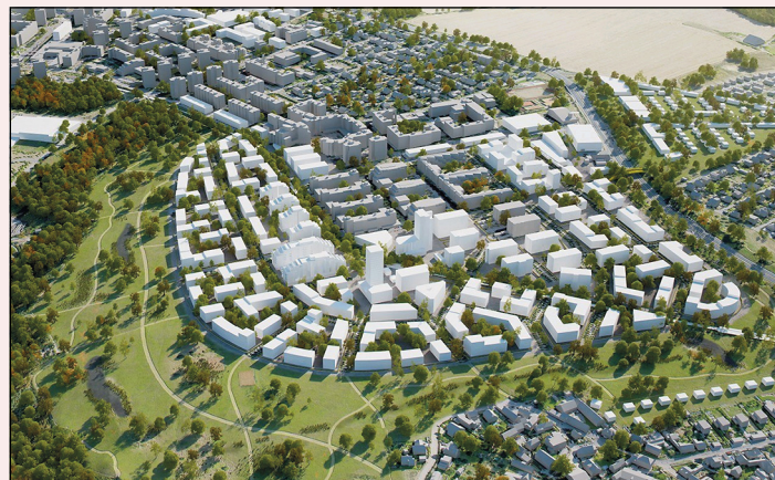
Studie dostavby sídliště Barrandov, zaplacená z peněz daňových poplatníků. Hustotou zástavby a ignorováním okolní přírody nápadně připomíná nechvalně plánovanou zástavbu Divčích hradů...