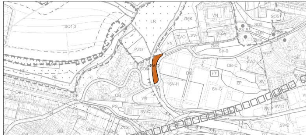
informativní zákres návrhu změny