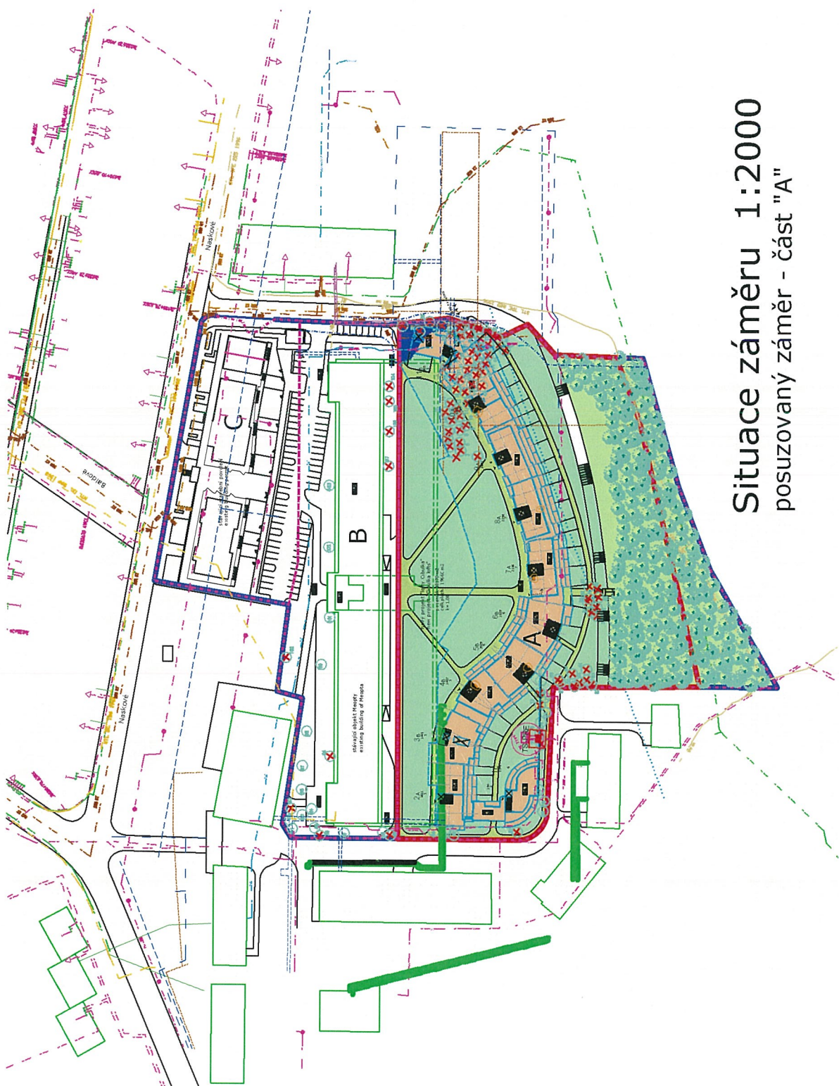
Situace záměru 1:2000 posuzovaný záměr - část "A"