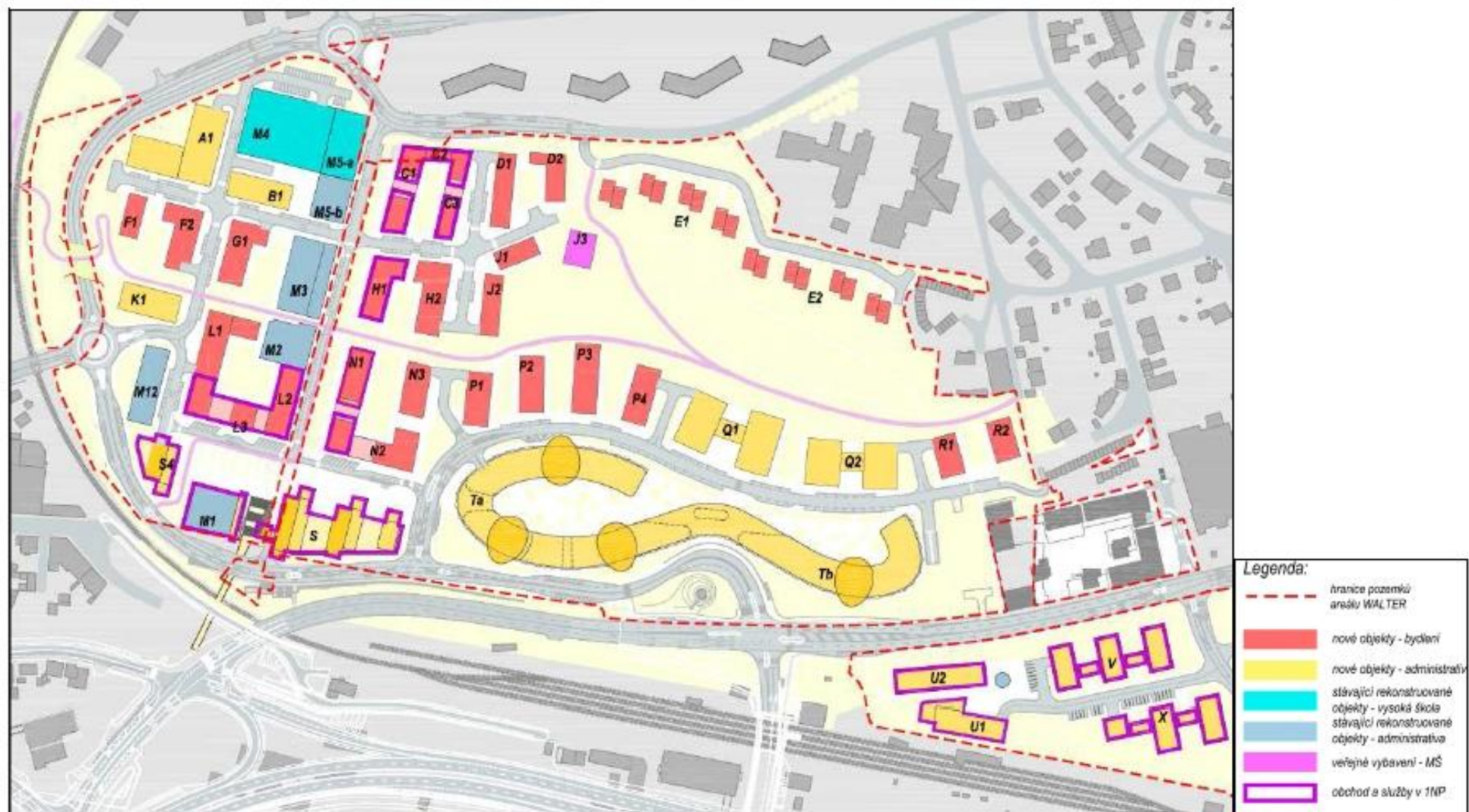
Obrázek 10 Návrh funkční využití urbanistických bloků dle Dodatku úpravy územní studie Walter – Jinonice

Stezka vedoucí přes lávku musí na západní straně sestoupit dolů na úroveň ulice, aby mohla podejít vyvýšenou železniční trať. Sestupné rameno lávky mělo být přímo uprostřed parcely, která je předmětem změny Z 1830.