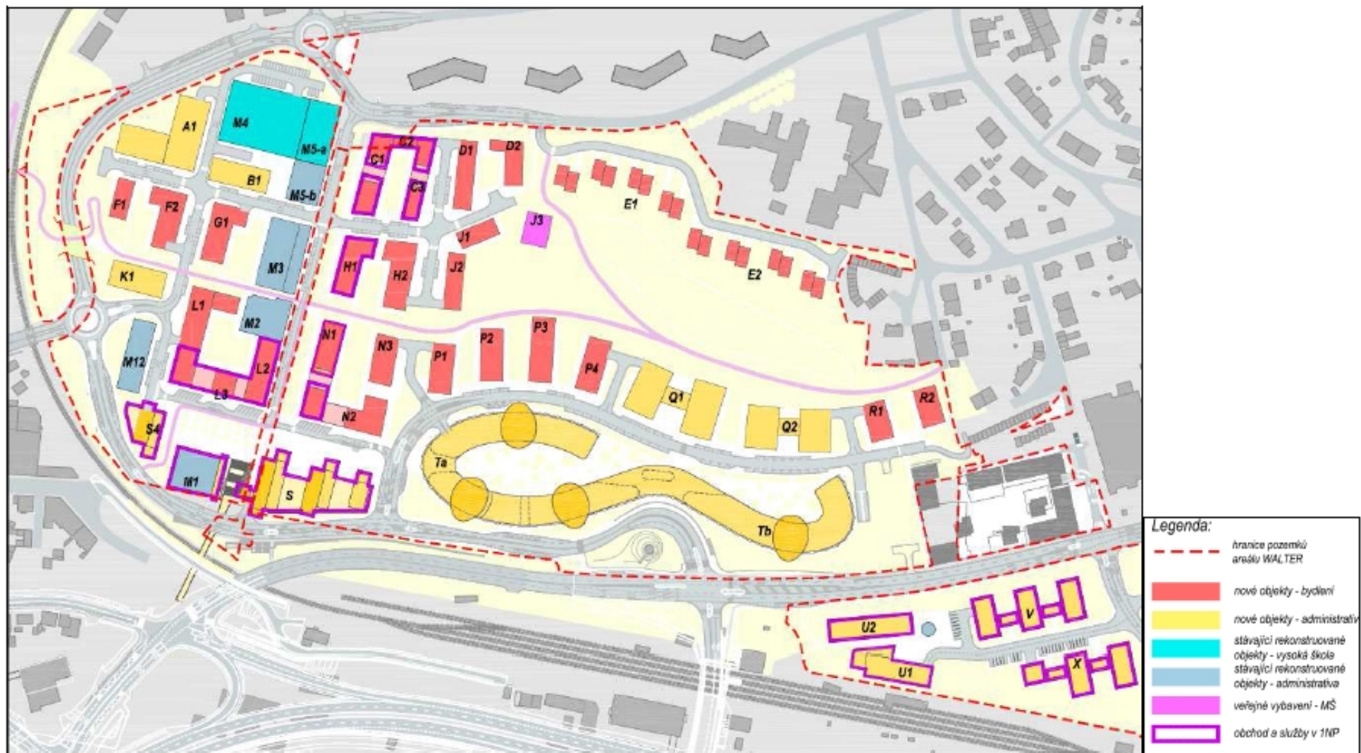
Obrázek 10 Návrh funkční využití urbanistických bloků dle Dodatku úpravy územní studie Walter – Jinonice

Stezka vedoucí přes lávku musí na západní straně sestoupit dolů na úroveň ulice, aby mohla podejít vyvýšenou železniční trať. Sestupné rameno lávky mělo být přímo uprostřed parcely, která je předmětem změny Z 1830.