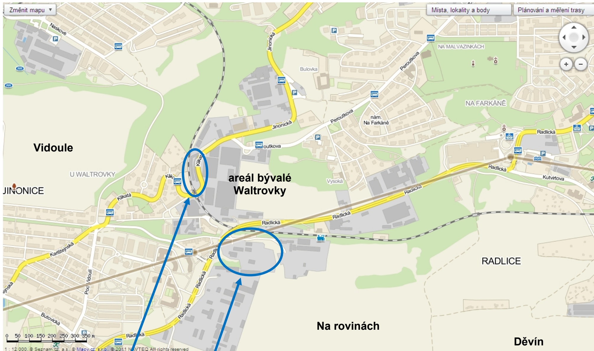
Obrázek č. 1 – Širší okolí Waltrovky s vyznačením lokalit, kde mají nastat změny Z 1830 a Z 2188