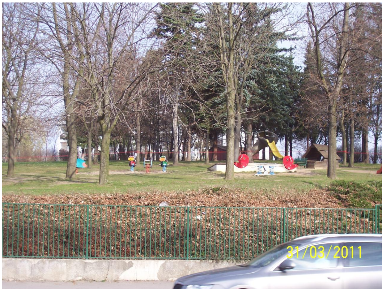
Fotografie z 31.3.2011 ukazuje zahradu MŠ ještě vcelku bez dělicího plotu.

V Košířích u velmi rušné ulice Peroutkovy stojí od roku 1965 mateřská škola s krásnou svažitou na jih orientovanou zahradou. Zvláště pěkná je horní část zahrady na pozemku parc. č. 1479/112 v k. ú. Košíře. Od ruchu ulice je odstíněná terénním „břehem“, samotnou budovou MŠ a mnoha vzrostlými stromy. Děti tam měly v městských podmínkách velmi dobré místo na hraní.